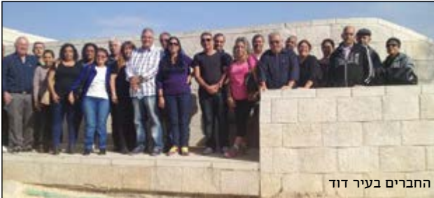
החברים בעיר דוד

■ בין התאריכים 13.11.2013-28 התקיים טיול חנוכה לירושלים, בו נטלו חלק 13 חברים עם בני/בנות זוגם. סיירו ברחבי הבירה, ביקרנו בעיר דוד, בשכונת משכנות שאננים ובמוזיאון מורשת מנחם בגין, וטיילנו בשוק מחנה יהודה הצבעוני. הטיול סוכם כהצלחה, החברים נהנו ושיבחו את ההדרכה והארגון. ■ ב-16.12.2013 יצאו חברי הסניף ליום כיף במלון דניאל ים המלח, לסיכום