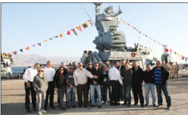
המשך בעמוד 48

■ בינואר 2014 התקיים טקס במלאת 40 שנה למלחמת יום כיפור, בבסיס חיל הים באילת. לטקס הוזמנו גם אנשי "צוות", יוצאי חיל הים.