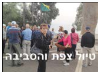
טיול צפת והסביבה