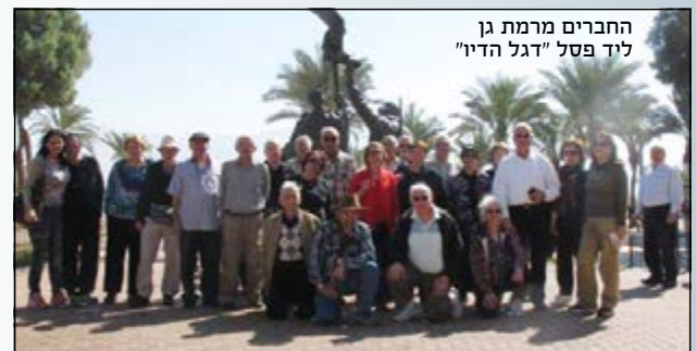
החברים מרמת גן ליד פסל "דגל הדין"