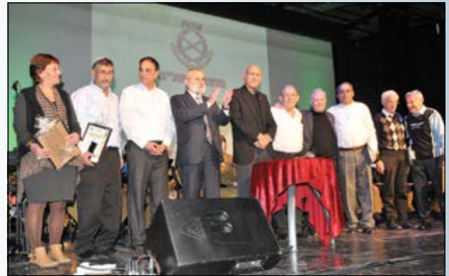
המתנדבים המצטיינים מקבלי התעודות לשנת 2013