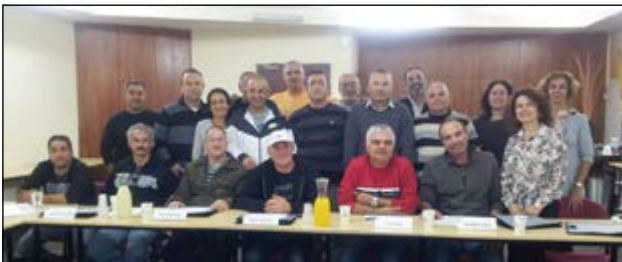
סדנת העצמה במחוז הדרום, דצמבר 2013