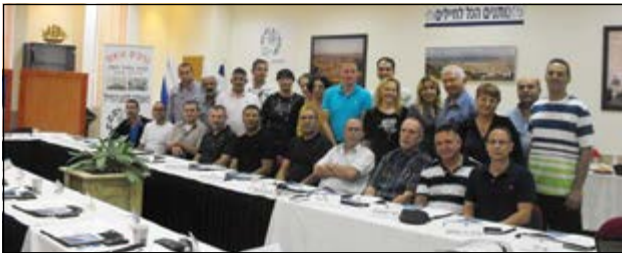
סדנת העצמה במחוז הצפון, נובמבר 2013