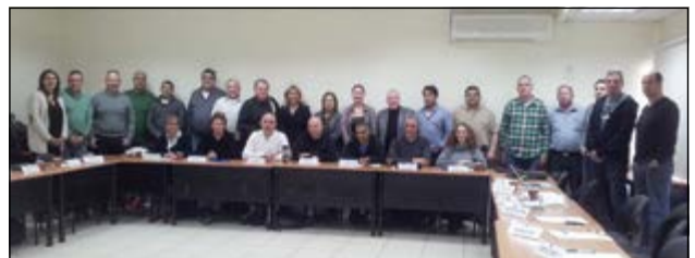
סדנת העצמה במחוז דן, דצמבר 2013