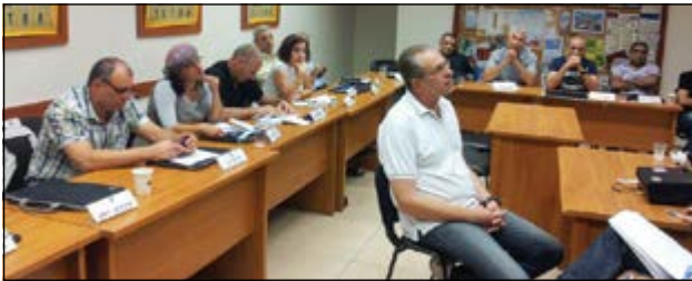
סדנת העצמה במחוז יהודה, סניף אשקלון, נובמבר 2013

להלן מועדי סדנאות לרבעון השני של שנת העבודה 2014: מחוז ירושלים - 30.4.14; מחוז יהודה - 14.5.14; מחוז צפון - 26.5.14; מחוז שרון - 28.5.14; מחוז דן - 18.6.14; מחוז דרום - 30.6.14.