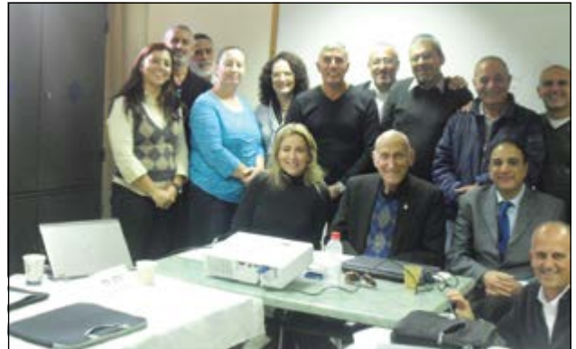
סדנת העצמה במחוז ירושלים, דצמבר 2013

מטרת הסדנאות הינה לפתח ולשפר את מיומנות השייוק העצמי בתהליך חיפוש העבודה ולהעניק כלים לניצול הזדמנויות תעסוקה. ממשובי המשתתפים בשנים האחרונות עולה, כי הסדנאות תרמו רבות והשיגו את מטרתן - השתלבות החברים במעגל העבודה.