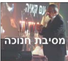
מסיבת חנוכה עם קאיה