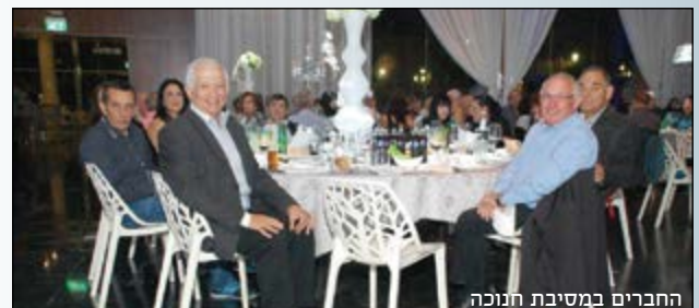
חברים במסיבת חנוכה

בחדשים האחרונים נפתח מועדון "צוות" לחברים, מתחת להיכל התרבות בכרמיאל. פעילות המועדון כוללת מפגשי חברים, הרצאות ומשחקי חברה. המועדון פתוח בימי רביעי בשעות הערב.