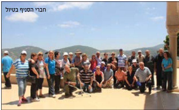
חברי הסניף בטיול

כאמור, אחד האתגרים הגדולים של עמיר, הוא לחשוף את הסניף בפני "הצעירים" - 65% מ-1,232 חברי הסניף בגילאים שעד 60. "בעיר שלנו מתגוררים קצינים בכירים מאוד בגילאים הללו - אלופים, תת-אלופים, אלופי משנה. הם אינם פוקדים את הסניף ולא משתתפים בפעילות. אילו היו עושים זאת, אולי היו סוחפים גם את יתר הצעירים. אבל אני מאוד מבין את פלח האוכלוסייה הזו: הם נמצאים במעגל העבודה, עדיין מגדלים ילדים בביתם ועומס החיים ודאי מקשה על היציאה מהבית. אבל אני לא מרים ידיים, לא מפסיק לשלוח להם מכתבים, וממשיך ליזום הרצאות המתאימות להם. כאשר אני רואה אפילו חבר אחד חדש מגיע עם זוגתו לפעילות, זה סיפוק עצום".