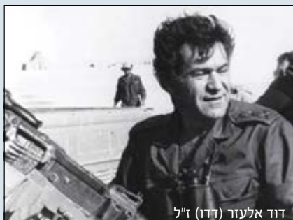
דוד אלעזר (דדו) ז"ל

מיוחד הערכה רבה לפועלו. ובכך להוביל "רחשי לב" הציבור שבחושיו הכריאים הבין את המשגה, מוקיר ומעריך את דדו שהוביל לסיום המלחמה בניצחון צבאי, 101 ק"מ מקהיר וכ-40 ק"מ מדמשק. העתקים נשלחו לנשיא המדינה, יו"ר הכנסת, נשיא בית המשפט העליון והרמטכ"ל.