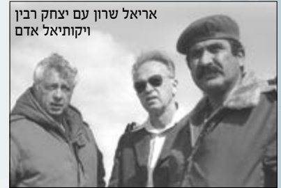
אריאל שרון עם יצחק רבין ויקותיאל אדם

באתי להצדיע לך גם אני היום, כראש המטה הכללי של צה"ל, כלוחם, כמפקד בצנחנים ובצה"ל שהלך אחריו בתחנות שונות בדרך, גם כשהדרגות כבר לא עיטרו את כתפיו. באתי לומר לך, כי הצבא המגן של העם אשר היה יקר לך כל כך, ימשיך להתקיים בצלמך ובדמותך עוד שנים רבות. ידעת לבחור את הטובים שבלוחמים, את האמיצים שבמסעתי, את דור העתיד של אלו שברבות הימים יהפכו להיות מפקדיו הבכירים וסמלי הגבורה של צה"ל - ובמנהיגותך הסוחפת