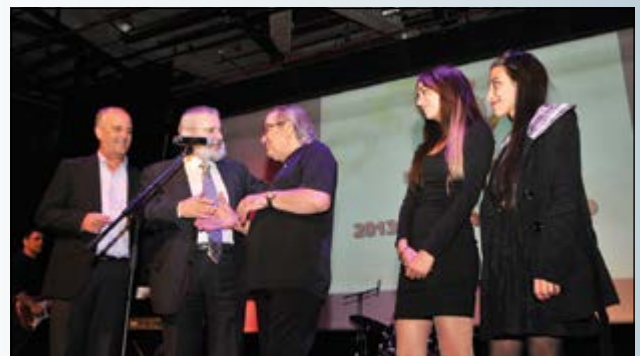
במרכז: הזמר בועז שרעבי

הופעה מרגשת של הזמר בועז שרעבי ותזמורתו במיטב שיריו סחפה את הקהל שהריע במחיאות כפיים ממושכות.