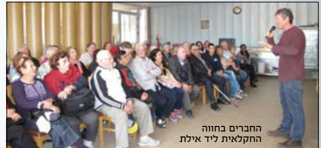
החברים בחווה החקלאית ליד אילת

■ חברי הסניף יצאו לארבעה ימי נופש וטיולים באילת ובערבה (עם אוטובוס צמוד והדרכה). בין השאר ערכו טיולים, נהנו משיט מפנק בים האדום ועוד.