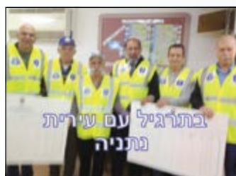
בתרגיל עם עיריית נתניה

■ ב-9.1.14 יצאו יותר מ-100 חברי הסניף לביקור במפעלי ים המלח. הם האזינו להרצאה מלווה בסרט אודות תולדות המפעל ותרומתו לכלכלת המדינה, סירו בבריכות האידוי ולאורך הגבול עם ירדן, ושמעו אודות קציר מלח, התייבשות ים המלח והבולענים. משם המשיכו לנאות הכיכר