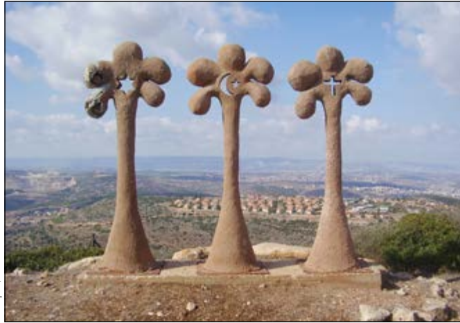
גן הפסלים בכאוכב אל היג'א

נמשיך צפונה בדרכנו לכפר הערבי כאוכב אל היג'א, הנמצא ליד היישוב יודפת בגוש שגב. תושבי הכפר דוגלים בדת-קיום ובשיתוף פעולה עם האוכלוסייה היהודית. במקום הוקם גן פסלים, שמטרתו להציג את שיתוף הפעולה בין שלוש הדתות המונותאיסטיות הגדולות - היהדות, הנצרות והאסלאם. שמו של הכפר משמר את שמה של עיירה יהודית מתקופת המרד הגדול ברומאים, בשילוב שמו של לוחם מוסלמי מצבאו של צאלח א-דין, שכינויו היה אל היג'א (אשר הצטיין בהתקפות פתע על גייסות הצלבנים). קברו של אל היג'א,