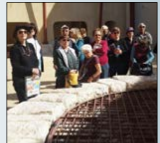
החברים בטיול בבאר שבע