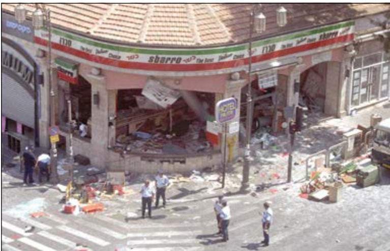
הפיגוע במסעדת סבארו בירושלים, 9.8.2001

לא מכבר זכינו במרכז נוסף של משטרת ישראל להכנת שוטרים צעירים, שצפוי כי יעמדו מול מראות הרס ופגיעה בנפש. להתמודדות נכונה עם המעמדים הקשים הללו. רבים מהמנחים שלנו הינם בעלי עבר במערכת הצבאית, ויכולים להוות מקור מידע ראשון במעלה, ולא רק תיאורטי."