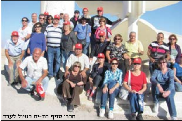
חברי סניף בת-ים בטיול לערד