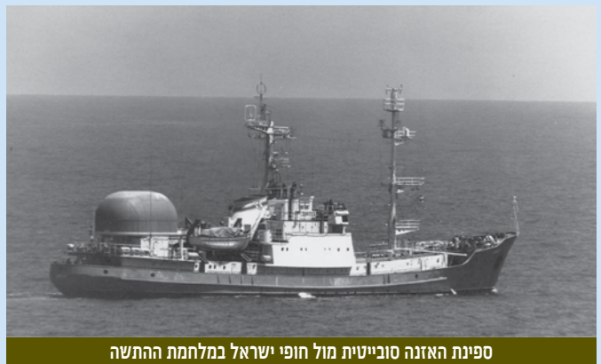
ספינת האזנה סובייטית מול חופי ישראל במלחמת ההתשה