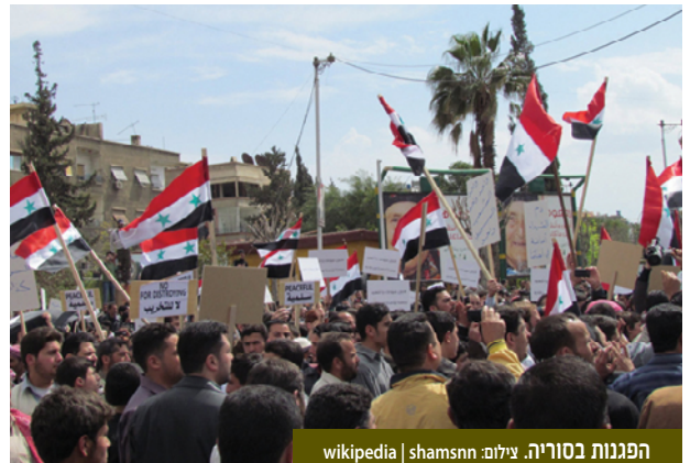
הפגנות בסוריה.

במצב החדש שנוצר במזרח התיכון נחלשים מנגנוני המדינה וכלי השליטה שלה לצד התחזקות הנאמנות לשבטיות, לחמולתיות ולדת האסלאם. חוסר היציבות המאפיין את מדינות הלאום הסובבות את ישראל מקטין את יכולתן לשלוט ביציבות הפנימית של משטריהן אך בו זמנית גם את יכולתן לשמור על המשך השקט היחסי שאפיין את המצב בגבולן המשותף עם ישראל. תהליכים אלה מחייבים את ישראל לחזק את מערכי השליטה והפיקוח על גבולותיה.