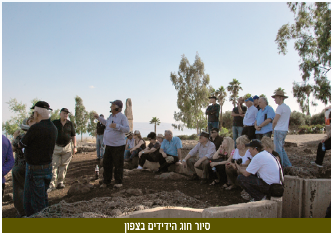
סיור חוג היזידים בצפון