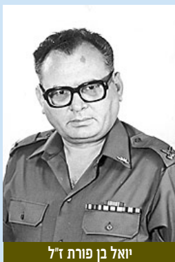
יואל בן פורת ז"ל

ש.מ.מ. קיימה ביום שני כ"ב באייר תשע"ב, 14 במאי 2012, ערב מורשת שנתי בנושא התרעה במלאת חמש שנים לפטירתו של תא"ל יואל בן פורת ז"ל. פתח את הערב תא"ל (מיל) אפרים לפיד שהעלה קווים לדמותו של יואל ובמיוחד הערך שביקש לחרוט על דגלה של 8200 הקובע: "התרעה למלחמה תושמע ברורות ובזמן".