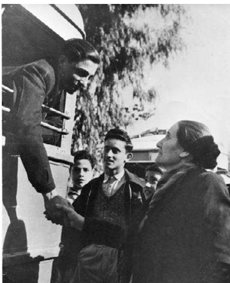
בן נפרד מאימו ב-1948. מהארכיון הצינוני

נמצאת בקשר עד היום. השנה החלטתי למקד את התערוכה בנושא הגיוס לצה"ל. התערוכה משכה קהל רב מאד וגם תקשורת. את הצילומים לתערוכה בחרה הפעם ועדה בראשות הצלמים אלכס ליבק, שלמה ערד ונועה מלמד. בימים אלה אני מתחילה לעבוד על התערוכה הבאה, שתתקיים בעוד שנתיים בבית האופרה - המשכן לאמנויות הבמה.