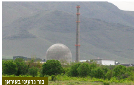
כור גרעיני באיראן

כדאי לשים לב במיוחד ל-3 מסרים שעלו מדברי הסיכום של ידלין: ההתקוממות בעולם הערבי עשויה אולי להתפתח לכיוון חיובי מבחינת ישראל בטווח הארוך. יתכן שמדובר בתהליך שגם אם ימשך זמן רב, בסופו של דבר יגבר כוחם של הצעירים שיצאו לרחובות במטרה לקדם ערכים שאנו שותפים להם: חופש, דמוקרטיה, זכויות אדם, זכויות נשים. לפיכך, כדאי שנאמץ מדיניות של "סבלנות אסטרטגית"; לעומת זאת, לא בטוח שמדיניות של "סבלנות אסטרטגית" כלפי איראן גרעינית תספיק. זאת, לנוכח