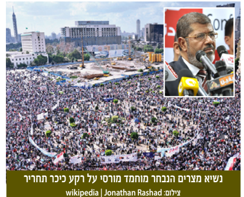
נשיא מצרים הנבחר מוחמד מורסי על רקע כיכר תחריר