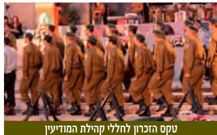
טקס הזכרון לחללי קהילת המודיעין