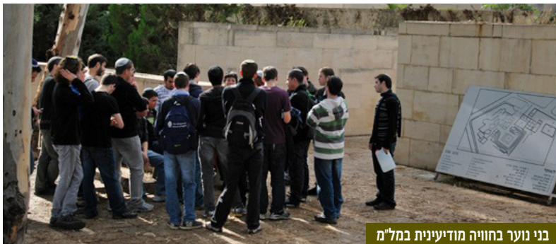
בני נוער בחוויה מודיעינית במל"מ