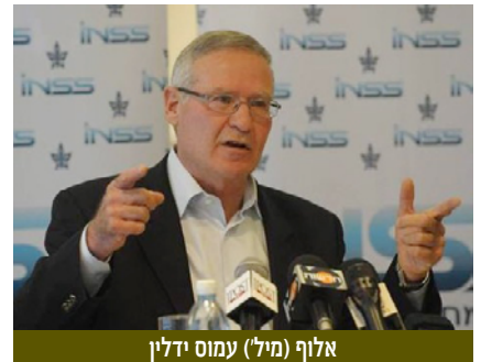
אלוף (מיל) עמוס ידלין

המכון למחקרי ביטחון לאומי (INSS) קיים (29-30 במאי 2012) את הכנס הבינלאומי השנתי ה-5 בנושא: אתגרי הביטחון של המאה ה-21 בחיפוש אחר הזדמנויות בסביבה סוערת. בכנס השתתפו בין השאר מומחים וחוקרי המכון, אנשי אקדמיה, צמרת הממסד הביטחוני-צבאי ובכיריה מהארץ ומחו"ל, אנשי תקשורת ואחרים. במהלך הכנס נבחנו 5 מכלולים: תקציב הביטחון בעידן של המחאה החברתית, ההתקוממות בעולם הערבי ומשמעויותיה, הצורך בפרדיגמות חדשות לקידום השלום עם הפלסטינים, ארצות הברית במזרח התיכון, לקראת הבחירות לנשיאות ואחריהן, והאתגר האיראני. המכון ביקש ליצור תמונה אחת אינטגרטיבית שתאפשר לקיים שיח פורה ולגבש מה שראש המכון אלוף (מיל) עמוס ידלין תאר "אקדמיה יישומית". ניתן לצפות בהרצאות שניתנו במהלך הכנס באתר האינטרנט של המכון: www.inss.org.il .