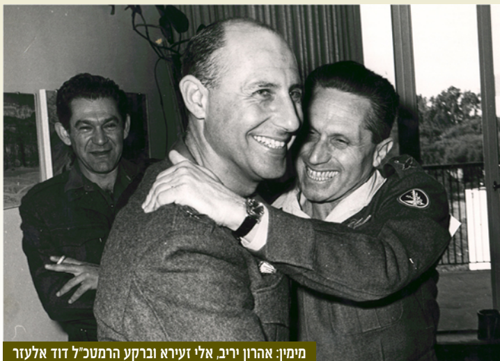
מימין: אהרון יריב, אלי זעירא וברקע הרמטכ"ל דוד אלעזר

ביום חמישי י"ח באייר תשע"ב, 10 במאי 2012, התקיימה בבית העלמין הצבאי בקריית שאול האזכרה השנתית לאלוף אהרון יריב (רבינוביץ') ז"ל שכהן בתפקיד ראש אמ"ן בשנים 1964 - 1972. מוקירי זכרו שנשאו דברים לזכרו שמו דגש מיוחד על תכונה בולטת שאפיינה את אהרלה, היותו בן אדם - "מענטש". תא"ל (מיל') עמוס גלבווע העומד לסיים בימים אלה כתיבת ביוגרפיה על חייו של יריב במסגרת הקרן להנצחת מורשתו הפועלת במל"מ, צטט דברים שכתב אלי זעירא ליריב בתקופת מלחמת ההתשה: "אהרלה היקר תודה על מכתבך.